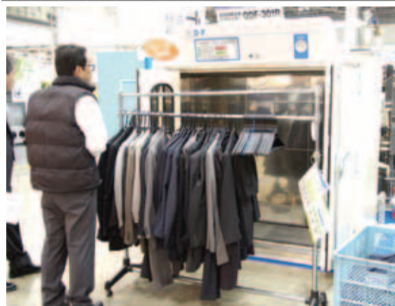
3月発売の「QDF-301R」。昨年のCLV21展示会では一足早く実演も行われ、注目を集めていた