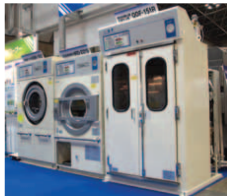
安全対策を施した東静の石油ドライシステムがさらに充実。左からドライ機、ドラム式乾燥機、高回収静止型乾燥仕上機

発売する。30着タイプも操作・機能面に関しては15着タイプと変わりはない。乾燥時間25分、溶剤回収率約85%を実現。同社では「30着を一度に処理でき、環境にも人にも衣類にも優しい機械」です。もちろんドラム式の乾燥機が得意としていた高級フアブリックに対応しています」としている。 ■高回収静止型乾燥仕上機「QDFシリーズ」の特長 ▽6コース仕上げで乾燥温度、乾燥風量、揺動が簡単セット ▽ドライ物、ウェット物の乾燥運転の切り替えも可能 ▽生蒸を標準装備、ドラ ▽衣類にダメージの少ない低温乾燥、東静独自の「熱風・冷風混合方式」により高効率乾燥を実現 ▽上下方向に配置された独自の溶剤回収コンデンサーで常に安定した回収・乾燥性能を保持 ▽省エネタイプの「DCインバーター」冷凍機を採用。最適運転で大幅な省エネ運転が可能 イ物、ウェット物の加工も可能 ▽衣類にダメージの少ない低温乾燥、東静独自の「熱風・冷風混合方式」により高効率乾燥を実現 ▽上下方向に配置された独自の溶剤回収コンデンサーで常に安定した回収・乾燥性能を保持 ▽省エネタイプの「DCインバーター」冷凍機を採用。最適運転で大幅な省エネ運転が可能 30着タイプの「QDF-301R」のメーカー希望小売価格は375万円(冷凍機込み、税別)を予定している。なお、15着タイプの「QDF-151R」は249万8000円(冷凍機込み、税別)。 同機に関する詳しい問い合わせは、東静電気本社(TEL 0558・76・2383)または各支店・営業所まで。