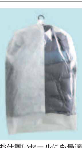
お仕舞いセールにも最適

かなめ流通グループの酒井化学工業（北九州市小倉北区、TEL093・561・9281）では、ランドリー用糊剤のクローバースターチ「香り」を新発売。同社では「今までもない香りのある糊剤で、クリーニング店に出すことにより違いをお客様にアピールできる付加価値のついたもの」としている。