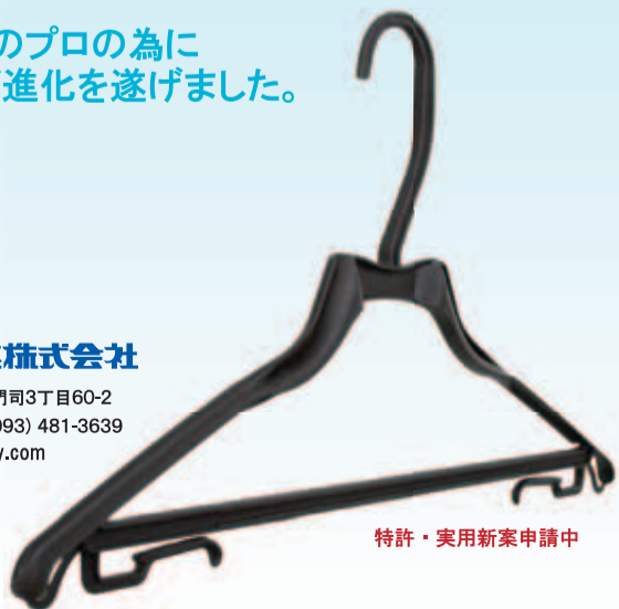
特許・実用新案申請中