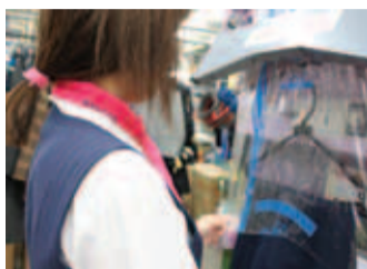
首に巻いた際、ポリマーで膨らんだ部分が重なってしまつという悩みを解決。より首にフィット。