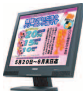
▲様々な使い方が可能な客側ディスプレイ

TERAOKAグループの(株)デジジャパン(東京都港区台場)はこの秋、人気のクリーニングPOS「DUKEシリーズ」に、スタッフの接客力と販促力が高いレベルで平準化し、売上アップを実現するDUKE310を新発売した。