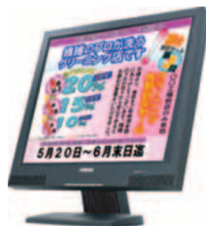
▲様々な使い方が可能な客側ディスプレイ

TERAOKAグループの(株)デジジャパン(東京都港区台場)はこの秋、人気のクリーニングPOS「DUKEシリーズ」に、スタッフの接客力と販促力が高いレベルで平準化し、売上アップを実現するDUKE310を新発売した。