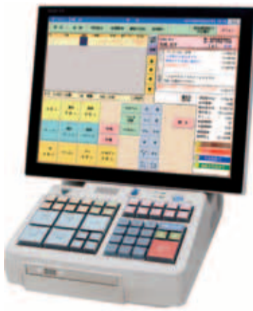
▲新機能充実でさらに進化した「DUKE310」