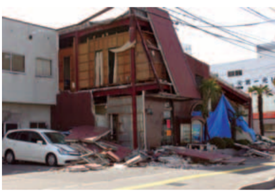
3月11日の大震災により、日本列島は東日本を中心に大きな被害を受けた。上の写真は仙台市、下は千葉県旭市

メニュー拡大に向け学んだ1年 1992年(平成4年)をピークに18年続くクリーニング需要の前年割れは、どうやらもう一つ数字を重ねてしまえば、今年、業界全体で