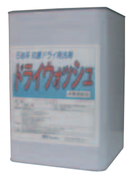
比較すると、1バッチあたり

・広島市西区、TEL 082-2332-4111 1)ではこのほど、石油系抗菌ドライ用洗剤『ドライウォッシュ』を写真IIを新発売。油性汚れに對してはもちろん、水溶性汚れの除去についても徹底的に追求した製品となっている。