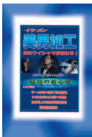
今なら1缶に1枚、ポスターをプレゼント中

安いいワイシャツしか持っていない人が多いみた——こんな答えが多いよです。そしてこの価格が【安いお店という良いイメージ】と同時に【品質も安いという悪いイメージ】を創られてしまつ事もあります。