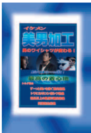
今なら1缶に1枚、ポ スターをプレゼント中

く、加工性が良好。▽（水 洗いはドライと比べて乾 燥性が悪いので）高速脱 水が出来る。▽タンブラ ー乾燥でほとんどの衣類 が乾燥出来る（一部はタ ンブラー後静止乾燥）。 ▽洗いが上がった衣類に色 泣き・縮み・スレ・シワが 無く、ドライ仕上げとほ ぼ同じになる。▽ワール、 カシミア、シルク、テン セル、レーヨン、羊毛ふ とん、ダウン、ニットな ど簡単に処理可能。▽投 入洗剤は一種類のみで、 誰でも素人でも間違い 無く、均一な品質。▽生 産コストが掛からない。 ▽加工撥水・防虫など がコスト安で、しかも完 全に出来る。▽ネットを 使用しないで洗い、乾燥 出来る（付属品のある衣 類を除く）。▽洗浄から 乾燥まで一台で出来る。 ▽省スペースである。 これらを、ほぼ完璧にや らなければならない。 我社では一つずつ研究 に取り組んだ。大変難し い道のりであったがテス トを繰り返して、ほぼ一 点にのぼるウェットクリ ーニングを行い、このシ ステムの開発に成功し た。きっと、クリーニン グシステムの革新に繋 がるものと考えている。新 システムは、今年4月に 発売となる。「ウェット クリーニングの革新は、 信じるあなたから始まり ます」。お問い合わせは、 （株）ツー・エム化成まで。