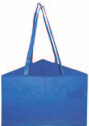
幅広く使える「コーナー ボックス」

例えば、①利用客にハ ンガー回収用のバッグと して渡せば、回収率の向 上に役立つ、②取っ手が ついているから、クリー ニング品を持ち運ぶエコ バッグにもなる、③有料 で自店の会員となった方 への景品として、1年目 と2年目の景品に変化を つけることにより安定・ 継続した囲い込みができ る、④折りたためるので は500×340×340×H360。なお、3 00枚より特注印刷も受 け付けている。 同社では、「コーナー ボックスは、アイデア次 第で幅広い使いみちがあ ります。ぜひ活用くだ さい」としている。