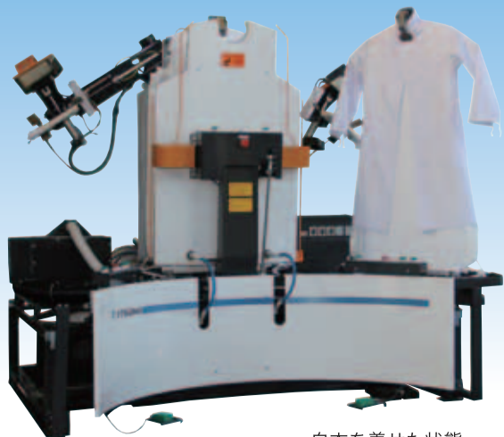
白衣を着せた状態