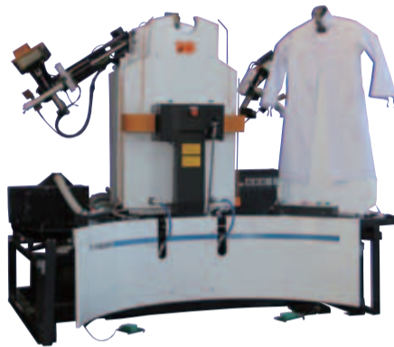
長袖半袖問わず、白衣やシャツなどいろいろな種類のもので掛けられ用途は幅広い

「白衣肩プレス+白衣胸プレス+白衣両袖プレス」を一台に集約。白衣衿プレスSC-500A Sと、このBT-600-Jの2台体制で仕上げするシステムで、トンネルに比べ品質は大幅UPし、1人3人立ちと、目標仕上げ枚数に応じて人数を変更しながら柔軟に対応できるという。 【世界初のダミー移動機構】 二対のダミーを交互に着せて真中に配置された熱板をはさんで左右に移動する機構は、プレスレイアウトとともに特許申請中。中心に立った作業