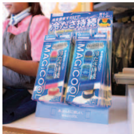
店頭販売用として登場したフック台紙

かなめ流通グループでは3種4色のプラスチックハンガーを販売していますが、今回新たに3色が加わり3種7色となりました。加わったのは以下の3色。①上着用ハンガー「a-1・ブルー」…すべての衣料に対応する、コストパフォーマンスの高機能性に優れたハンガー。②同ブラウンの向きはLとRがある。1ケース400本入り。③ワイシャツ用ハンガー「b-1(L/R)・ピンク」…襟の高いワイシャツでも安心。襟つぶれを防止し、耐久性もバツグン。フックの向きはLとRがある。1ケース400本入り。