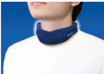
▶進化して再登場したフィットモデル

2010年からかなめ流通グループが取り扱ってきた、冷感持続スカーフ「マジクール」が進化して帰ってきた。当製品は水に浸すだけで濡れタオルのような涼しさが長時間持続するスカーフである。開封時は一見ただの布切れだが、水に浸すと生地の中の超微細吸水ポリマーが多量の水分を吸収し、しっかりと保水する。水分が気化する