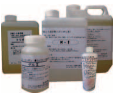
幅広く愛用されている松井化学のシミ抜き剤

また、使い方が楽だといつことも、忙しい春のシーズンには、うれしいことだ。非常にシッコイ油汚れのシミや食べこぼしのシミは「K-1」(1kg6000円)。「インク」(2kg6000円)。ジェルインクなどの不溶性のシミは「ゲル2」(250g1500円)で取り除き、その後、地色にやさしい漂白剤の「シミナックスα」(400cc3000円)を徹底させれば、99%近くのシミに対応できるという。また、パートス