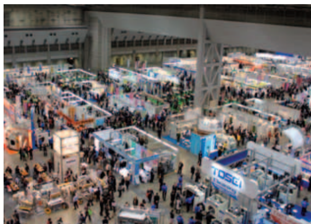
前回東京大会とほぼ同規模となった今大会。見どころも多そうだ

業界最大のイベントであるクリーンライフビジョン21(2012東京国際クリーニング総合展示会)の開催が間近に迫ってきた。今回は「今日のクリーニングにできること。明日のクリーニングにできること」をテーマ