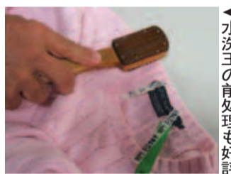
水洗王の前処理も好評

水洗王でキレイに洗った撥水加工の付加価値をつけるのがAMGの水超撥水剤「AMGガード」。撥水性・撥油性に優れ、低コストタイプとして好評の加工剤。