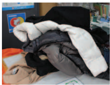
▲3月が暖かったため、例年より早く重衣料が動いた(写真はイメージ)

今号7面の「かなめ流通グループ ホットライオン」では、「ふとんクリーニング」を特集しました。外注・自家処理を問わず、ふとんは潜在需要が多そうです。しっかりとアピールして、取り込みましょう!