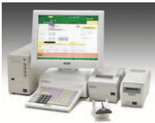
大画面採用で一段と見やすくなった、 レジコム「CT-5500」

「スターチAg+」 「スターチAg+」は、特別な設備も 不要なので気軽に導入で きる。しかも洗って濯ぐ だけの簡単な操作性に加 え、優れた防縮効果で縮 みや変形が最小限に抑え られ、その後の仕上げも 楽なので、導入企業が年 々増加、今やドライ衣料 を水洗いする際の定番と なっている。