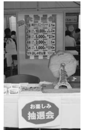
豪華商品が当たる抽選会も