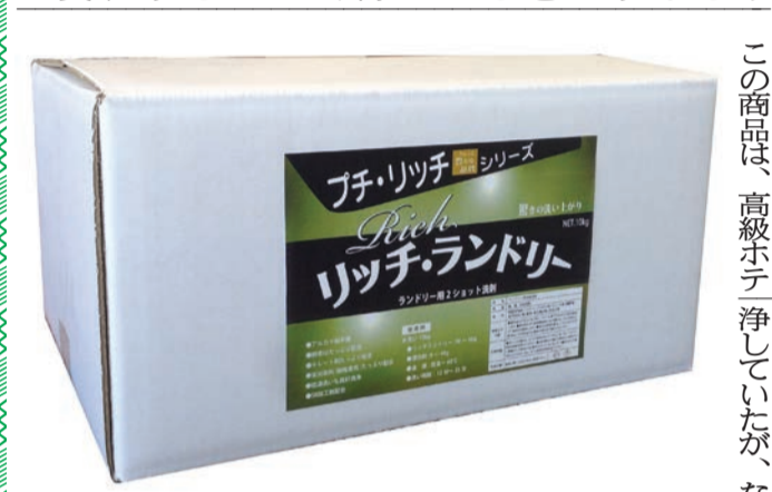
▲驚きの洗いがりが実感できる「リッチ・ランドリー」

20数年間に続いたデフが上がり、他社と格差がレは変化をしてくる。生まれるものが必要となる。不安・人件費の上昇になってきている。そして、この度2種類のシリーズ製品の発売を開始。フレは待たなしの状況になってきた。 「ちょっと贅沢な洗いを手軽にしませんか?」と提案している。 「もっとすっきりと汚れを落としたい! 輝く白さを取り戻したい!」というお客様からの強い要望から出来上がったという「リッチ・ランドリー」は、とにかく高性