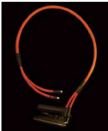
▲しなやかで折れにくいので、長持ちする

かなめ流通グループでは、スチームアイロン用テフロンホース「SGWアイロンホース」(II写真)の販売を行っています。今までのアイロンホースは、スチーム用・ドレイン用と、2本のアイロンホースが必要