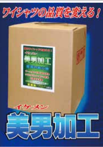
ワイシャツの品質を変える！

専用吊りバンド(別売)を使用することで、吊り部の損傷が低減されることも特長です。