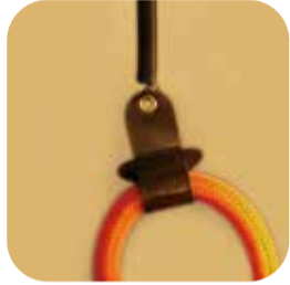
▲専用吊りバンドでさらに長寿命に

でしたが、この「SGWアイロンホース」は中間部を1本にした新しいアイロンホースで、2本をまとめる必要がありません。