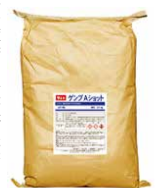
▲ 衿・袖汚れにさらに効く「ゲンブAショット」

また、これからの季節に最適なのが、ランドリ用ワンショット粉末洗剤の「ゲンブAショット」。同社では、「衿・袖汚れにさらに効く洗剤」で、夏でも頑張るサラリマンをキレイなシャツ