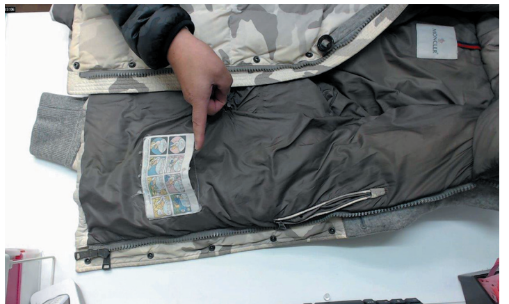
▲検品時に確認した生地の破れなどを記録することで、責任の所在を明確にできる

それでいて一度設定したら通常業務に戻るだけ、簡単操作で運用が可能です。受付時やマーキング時に写した画像を長期間保存できるので、お客様から問い合わせがあった際、洗う前の状態を画像で確認できます。既に導入しているところでは、お客様に感心されることも多々あります。