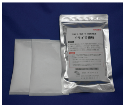
▲ドライ機専用のドライで爽快

でガチャマシンの設置し、分包タイプの洗濯槽快を販売している。洗濯3億回・300万個、ドライで爽快は1万個、ドライで爽快は1万個を出荷したと紹介した