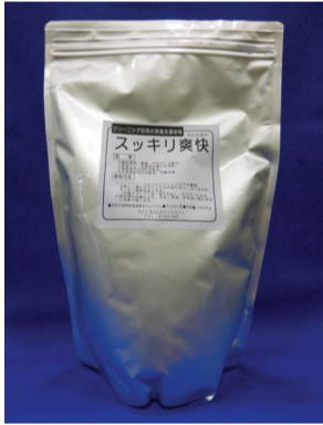
▶ランドリー機専用のスッキリ爽快

が、洗濯槽快は1袋で30回の洗濯が可能なおから「洗濯3億回」(ドライで爽快も1袋で300万回)が目安(条件による)となっているため、「300万回」の実績を持つ。同社では、洗濯関連の商材をこの他にもラインナップ。ドロ汚れ&油汚れ洗剤(とっても爽快)、油性ボールペン、クレパス、襟の皮脂汚れなどを簡単に洗浄、血液汚れ浸け置き洗剤(ルナマジック)などは、生地を傷めず、色落ち、変色も気にせずしっかり落とせる部分洗剤として、業界問わず人気商品となっている。