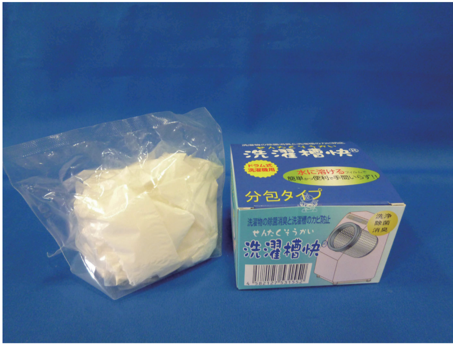
▲遂に年間出荷販売数100万包を突破した「洗濯槽快」の分包タイプ