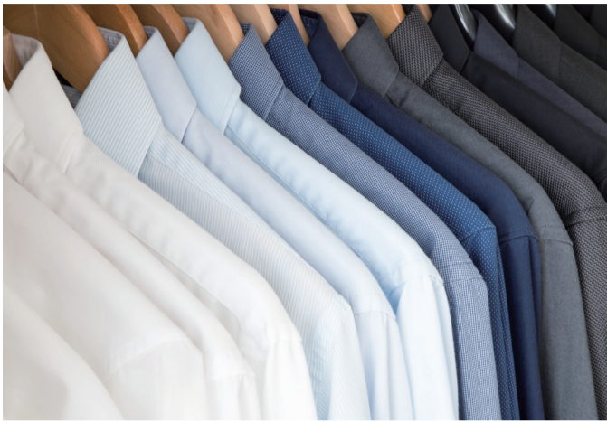
▲スーツやワイシャツなどに使用可能

〒101-0043 東京都千代田区神田富山町8番地アツミビル6階 電話03(5295)0135 FAX03(5295)0130 http://www.kaname-g.jp/ 発行人 船木春男 編集人 坂本吉敬