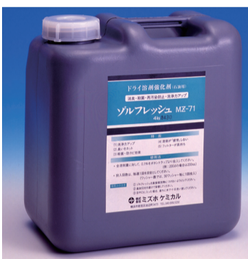
▲これまでは「ドライ溶剤の強化剤」として販売されてきた『ゾルフレッシュ MZ-71』を除菌抗菌剤として提案していく

▽溶剤をリフレッシュして洗浄力アップ▽再汚染を防止し、洗浄時間も短縮し、フィルタも長持ち▽非イオン系なので石油ソープにも適合する