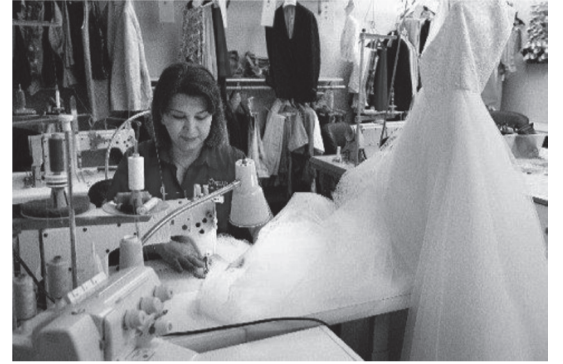
ウエディングドレス専門担当者がドレスのケアに当たっている

オーシャンサイドクリーニングは、ウエディングドレススペシャリスト協会によるトレーニングの認定を受けており、ウエディングドレススペシャリスト協会のメンバーでもあります。彼らはこの専門分野でフロリダ地区で高い評価を得ており、花嫁は会社が調整したウエディングドレスの結果に非常に満足しています。