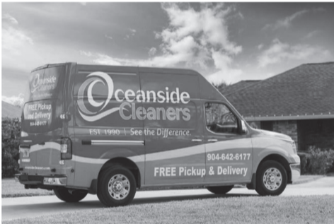
コンパクトカーによる迅速な宅配サービス

同社は、進化する業界と変化する時代への適応に積極的に取り組んできました。スマホなどを使用し顧客は注文の宅配集荷を簡単に同社のルート車と調整してスケジュールできます。