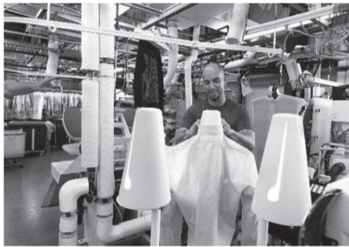
社内顧客スタッフが顧客の身になって検品を行う

まれに返品された場合、情報はすぐに文書化されます。次に、アイテムにフラグタグが付けられ、やり直しが成功するように手作業で完了します。