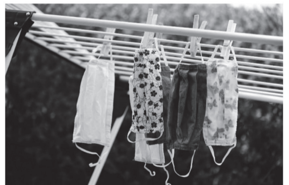
マスクの洗濯代行まで...

同社では地域の感染不安対策のために、マスクのクリーニングまでサービスしています。午前9時までにはマスクを専用のビニール袋に入れたものを受け取った場合、午後5時までには消毒し納品します。