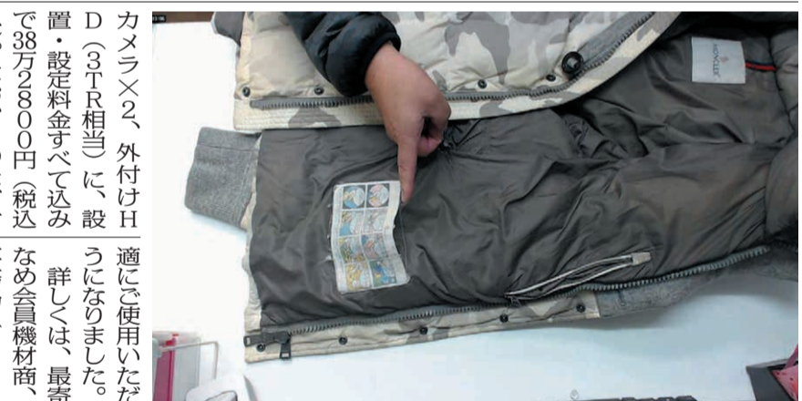
▲検品時に確認した生地の変色などを記録することで、責任の所在を明確にできる

ドカメラでは高額になり、業界では使えません。受付検品レコーダーはWebカメラで外付けハードディスク(HDD)に録画するので、HDDを交換すれば長期保存が可能。また、高精細な4K画像録画も可能なほか、お客様との会話の確認、従業員のオペレーションの確認、あいさつ、商品説明、キャンペーン情報の告知、お渡し点数の確認、タック取れなどの商品の確認、工場内からの商品探しの特定、仕上げ時に元の形状の確認、破損の確認など使い方は様々です。