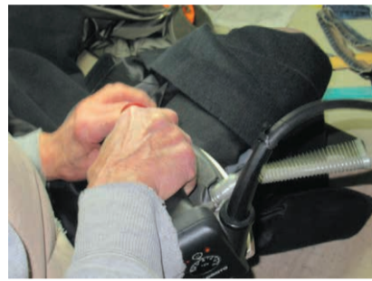
▲アイロン時にも違いが分かる!

そんな際に、ぜひ使っていただきたいのが、かなめ流通グループのランドリー用加工仕上げ剤「美男(イケメン)加工