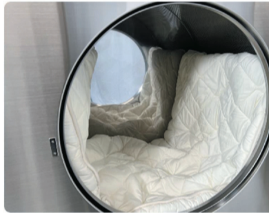
▲敷ふとんなどの大物の投入もラクラク

ドラム十タンピング乾燥により、寝具類を始めとする大物も、従来のふとんよりさらさら仕上がります。同機は「毛布やふとんケア」のニーズに合わせるべく、簡単に「敷ふとん」や「大量の毛布」乾燥などができるよう大型化に対応したものです。