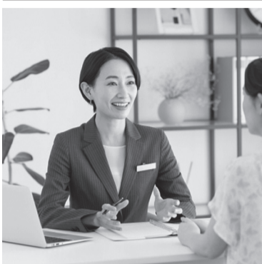
▲スタッフのプライバシーを守るため、名札の実名記載をやめる企業も増えている(写真はイメージ)

「お客様は神様」ではない。セクハラ・パワハラなど様々なハラスメントも、その一つ。スタッフが社会的な問題とな