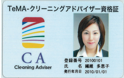
▲資格証。約500名が取得している

コロナ禍を経て、クリーニング、「知識が増えたので接客に自信が持てるようになった」や「ニーズに合わせて加工を提案することで売上アップにつながった」など、接客の仕事により前向きに臨めるようになったという資格取得者も少なくない。もともとは東京の特定非営利活動法人 日本繊維商品めんてなす研究会(略称・TeMA)が立ち上げた資格制度であるが、名古屋(中日本クリーニング協会)、大阪(関西繊維商品めんてなす研究会)でも試験が受けられるようになり、3団体の会員外の業者や個人での受験者も増加。これまでの取得者は延べ