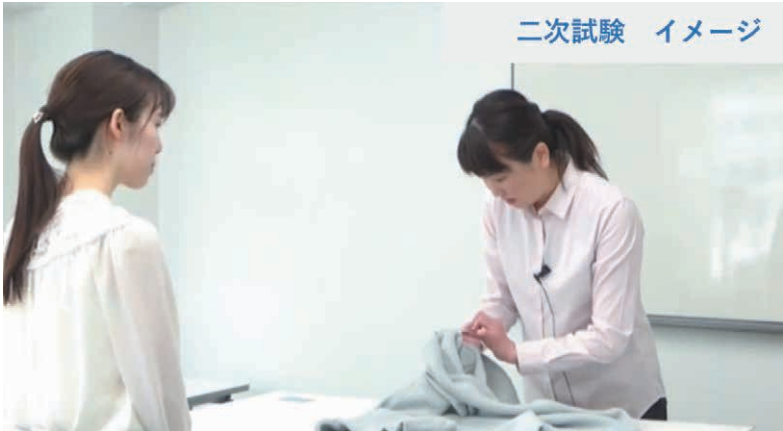
▲一次試験は筆記のみだが、二次試験は約4分のロールプレイング形式で行われる

カウンター接客のプロの証 498名にのぼる。 ■一次試験の申請は8月15日まで 今年度の試験(一次筆記試験)の申請期間は7月25日~8月15日で、一次試験は9月12日に東京、名古屋、大阪にて一斉開催される。各地の試験会場は以下の通り。 【東京】日本クリーニングセンタービル(東京都文京区後楽) 【名古屋】ウインク愛知(名古屋市中村区名駅) 【大阪】ドーンセンター(大阪府中央区大手前) 一次試験の受験料は、前述3団体の会員企業は1万1000円、その他は1万3200円。