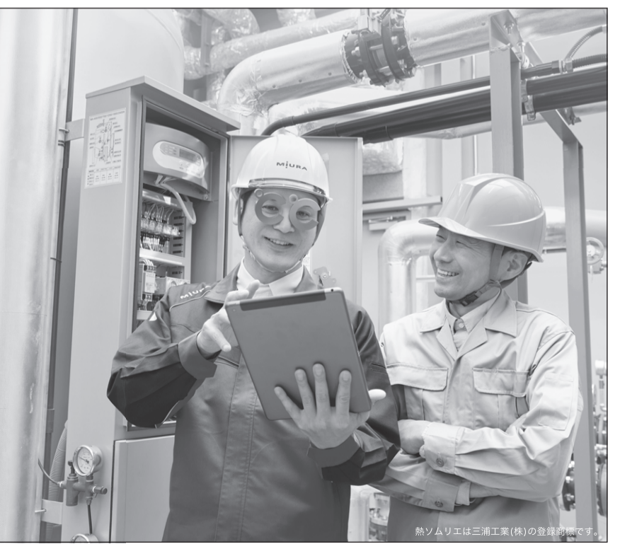
熱ソムリエは三浦工業(株)の登録商標です。

熱・水・環境のベストパートナー MiURA 三浦工業株式会社 東京本社/東京都港区高輪2丁目15-35 〒108-0074 松山本社/愛媛県松山市堀江町7番地 〒799-2696 TEL 089-979-7000 FAX 089-978-2321