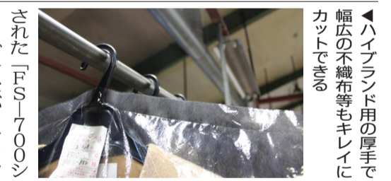
▲ハイブランド用の厚手で幅広の不織布等もキレイにカットできる

以前は海外のメーカーに製造を委託していたが、今回から内製化に変更。三幸社オリジナルの機械として一層、磨きがかかった。